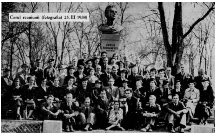
Corul reuniunii (fotografiat 25. III 1938)