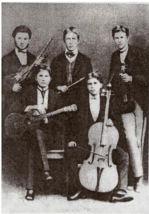
Cvartetul lui Ciprian Porumbescu, la gimnaziul din Suceava

prin comunicarea care determină colaborarea, ceva din gloria de altădată, mai curând strălucirea, dar nu și materia care-i asigura acea strălucire. Dacă interesele, și cele ale politicienilor, și cele ale clerului, nu vor interveni brutal, sub imboldul clientelismului, în viitorul apropiat al culturii, probabil că se vor dura clipe de excepție și, de ce nu?, va renaște pentru a nu mai fi uitată vreodată memoria Sucevei care să merite Suceava memoriei.