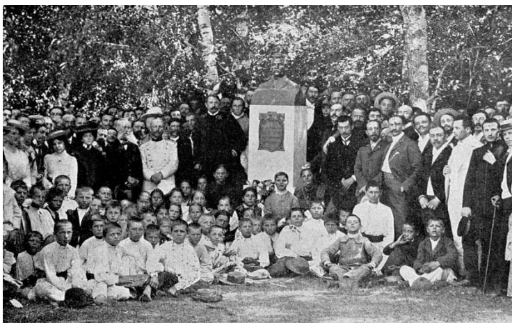
Dumbrăveni, dezvelirea bustului lui Eminescu.